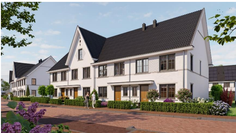
Woningtype Ancolie (tussenwoning 2a, 2b en kopwoning 2ak(s))

Bovenstaande artist impressions en overige artist impressions van dit project geven slechts een indicatie van de toekomstige situatie. Hieraan kunnen dan ook geen rechten worden ontleend.