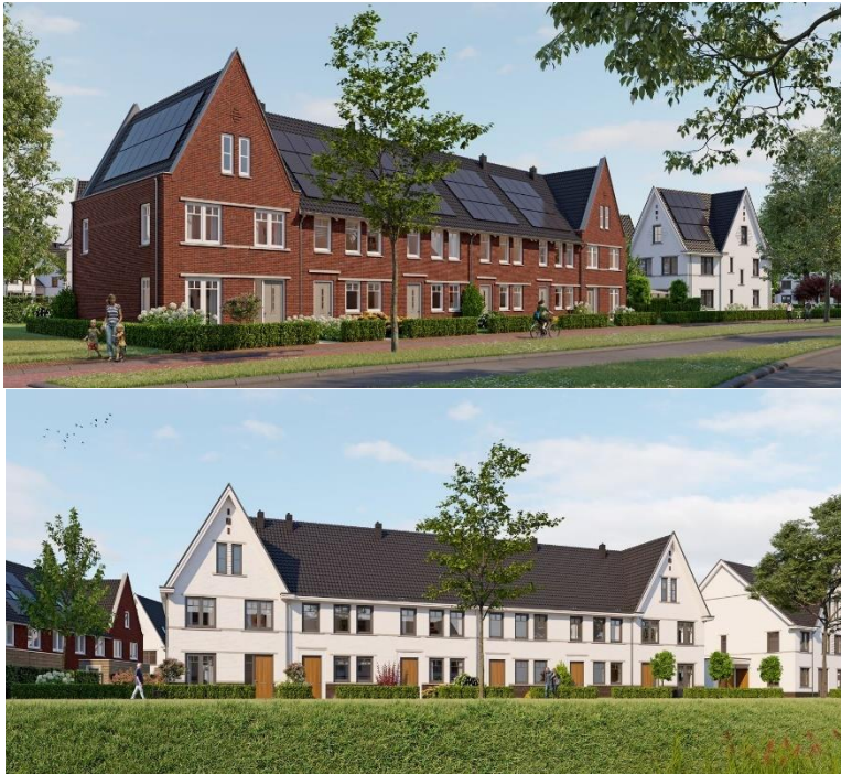
Woningtype Camélia (tussenwoning 1a(s),1c(s)) en Cyclamen (kopwoning 1bk(s) en 1dk(s))

Project: Quatrebras Park Quartier III, fase 1 65 woningen te Badhoevedorp Datum: 2 mei 2022